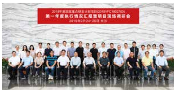
·永清环保作为牵头单位获批承担国家重点研发计划“中南有色金属冶炼场地综合防控及再开发安全利用技术研发与集成示范”项目