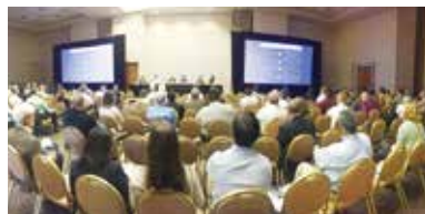
·作为中国唯一企业代表，永清环保出席国际巴特尔环境修复大会