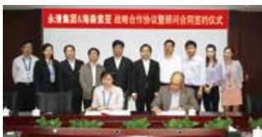
·永清与美国海森索亚公司签订战略合作协议