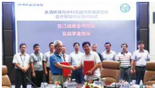
·永清环保与中科院城市环境研究所合作框架协议签约仪式