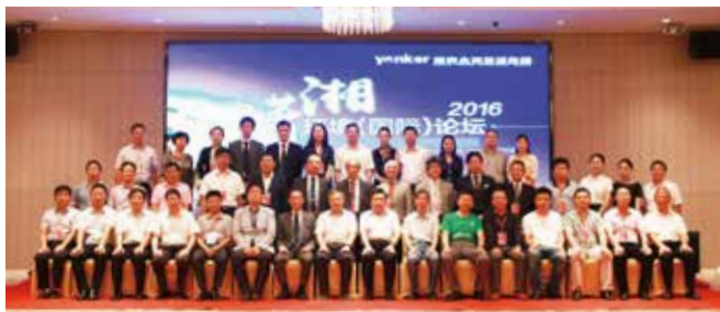
·永清创办的“潇湘环境（国际）论坛”，已具备承担高层次和国际化环保论坛的实力