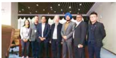
·印度塔塔集团与永清共商合作

“为子孙后代留一片蓝天，为人类健康存一川碧水”。永清一直致力于提升技术能力和综合竞争力，实现创新进步，为公司持续发展储备动力。