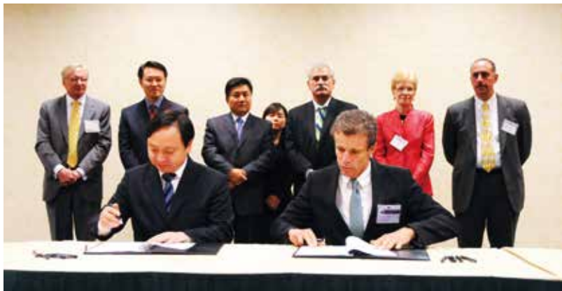
·永清环保并购全球领先的拥有上千修复案例的土壤及地下水修复企业美国 IST 公司

“为子孙后代留一片蓝天，为人类健康存一川碧水”。永清一直致力于提升技术能力和综合竞争力，实现创新进步，为公司持续发展储备动力。