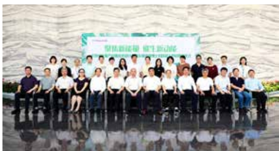
·长沙市环境治理技术与应用产业链技术研讨会暨永清环保博士后科研工作站授牌仪式隆重举行